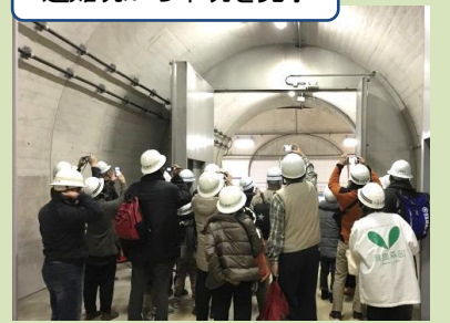
避難坑から本坑を見学