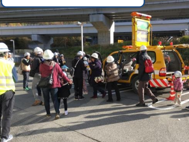
パトロールカー展示