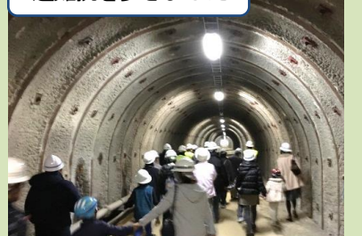
避難坑を歩きました