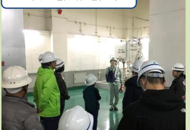
自家発電設備を見学