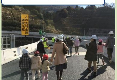
供用前の道路を歩きました