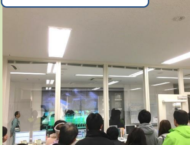
交通管制室を見学