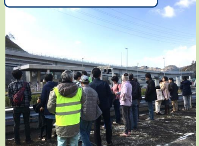
新名神高速道路を展望